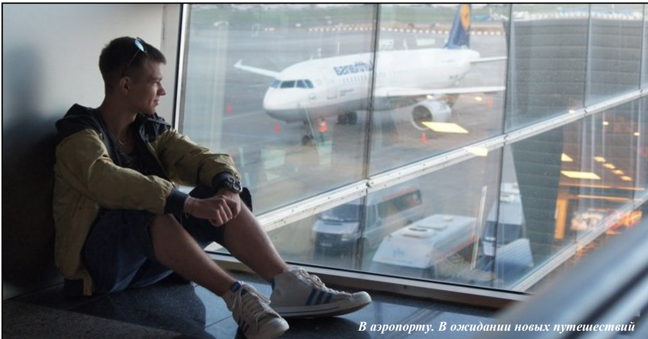
В аэропорту. В ожидании новых путешествий