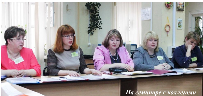
На семинаре с коллегами

- Да, поток студентов в последнее время увеличился. Наш техникум уже более ста лет занимается подготовкой строителей, недавно отметили 115-летний юбилей. Раньше наш техникум был основным учебным учреждением в области по строительной специальности. У нас был обмен опытом с другими городами – Омск, Пермь, Чебоксары, Уфа. Мы часто собирались, даже конференции проводили, была одна учебная база. Сейчас нас всех разъединили, прежние связи разрушились, хотя мы и стараемся их поддерживать, например, на олимпиадах по строительным специальностям, где наши студенты всегда входят в число призёров, а часто занимают и первые места.