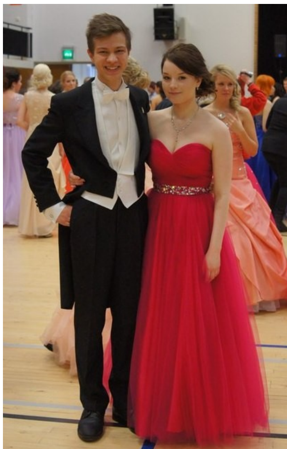
Традиционный зимний бал в финской школе «Vanhat tanssi» - «Старые танцы».

интересная - пожилая супружеская пара, Их дети были уже взрослые и жили отдельно. Им было скучно, и они приглашали к себе иностранных студентов. Отец был преподавателем в университете. Он постоянно угощал меня пивом, мы сидели и разговаривали по вечерам. Финны вообще много пьют, но алкоголь у них очень дорогой. А еще у них огромные холодильники, а еды там почти нет, разве что сосиски какие-нибудь. Нет такого, как у нас, – наварить суп на неделю. Обычно покупают и сразу всё съедают.