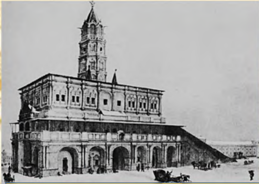
Школа навигационных и математических наук

Первая ремесленная школа, которая называлась "Школа навигационных и математических наук", была основана в Москве 14 января 1700 года . В период с 1701 по 1721 года были открыты медицинская, артиллерийская и инженерная школы в Москве, морская академия и инженерная школа в Петербурге, горные школы при Уральских и Олонецких заводах. Профессиональное образование в те времена являлось делом государственной важности, поэтому любое неповиновение царским Указам сурово каралось, вплоть до смертной казни. Поскольку российская промышленность нуждалась в специалистах (кораблестроителях, моряках, металлургах, артиллеристах) петровская школьная реформа была направлена, в первую очередь, на получение подростками профессиональных знаний и технической грамотности. Под его руководством были созданы школы для солдатских детей и введено обязательное обучение духовенства и дворян. То есть, школа стала сословной, а учеба приравнивалась к службе.