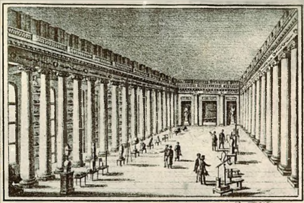
Горное училище, во дворе которого оборудован тренировочный рудник со штольнями и шахтами

В 1774 году в Петербурге было открыто горное училище, во дворе которого был оборудован тренировочный рудник со штольнями и шахтами. В 1767 году в том же Петербурге при морском госпитале была открыта и первая государственная хирургическая школа. На момент основания ее штат состоял всего лишь из одного прозектора, двух учителей и пяти профессоров. Впоследствии эта школа "разрослась", и стала именоваться Военно-медицинской академией.